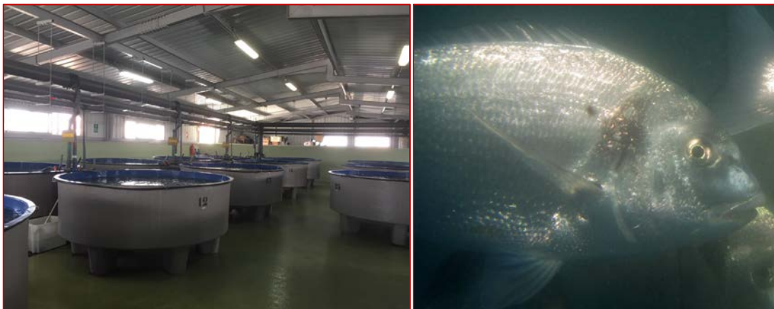
Tanques de experimentación del Instituto de Acuicultura Torre de la Sal y fotografía realizada con una cámara submarina de una dorada nadando en uno de los tanques.